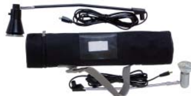
Sac de transport en nylon renforcé