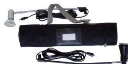
Sac de transport en nylon renforcé